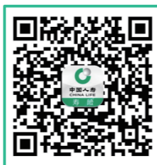
中国人寿寿险APP下载

2.线下理赔方式: 学生家长可将保险理赔资料交至保险公司各营业网点或将保险理赔资料交至学校保险服务窗口。保险公司各营业网点信息可关注官方微信公众号“中国人寿股份上海市分公司服务号”,在“产品中心”-“学生平安保险”专栏中查询。